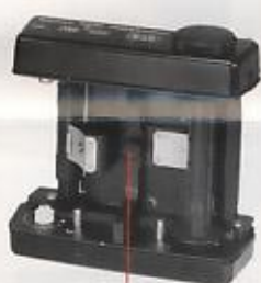
Filmtyp-Wahlrad sélecteur de film 120/220