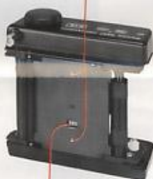
Sichtfenster fenêtre du type de film