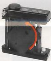
Paßkerben repères de positionnement et guides